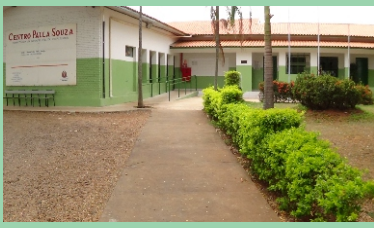
Unidade 83 - Sta. Rita do Passa Quatro - SP